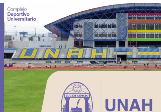
Complejo Deportivo Universitario

Canal 60 Cable color Canal 102-361 Por Internet: www.utv.unah.edu.hn Aplicación para Android: UTV HD