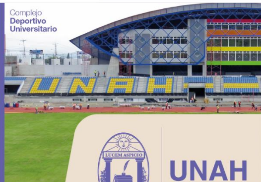
Complejo Deportivo Universitario